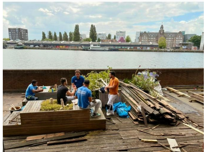
De sloopfase, eind juni...