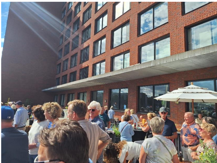
Een goede opkomst op Sail-zaterdag voor het goede doel

Er werden 1275 handtekeningen opgehaald, brieven geschreven en bezwaarschriften ingediend. Maar twee jaar later begon de bouw toch echt. Toen de bouwput een feit was, liep hij vol water. Een laatste protest.