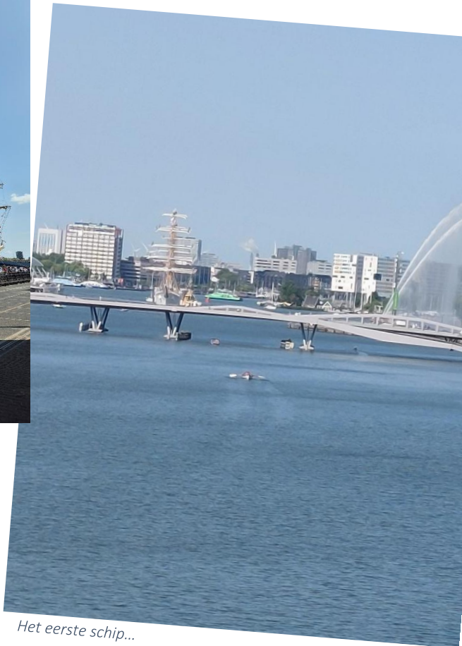
Het eerste schip...