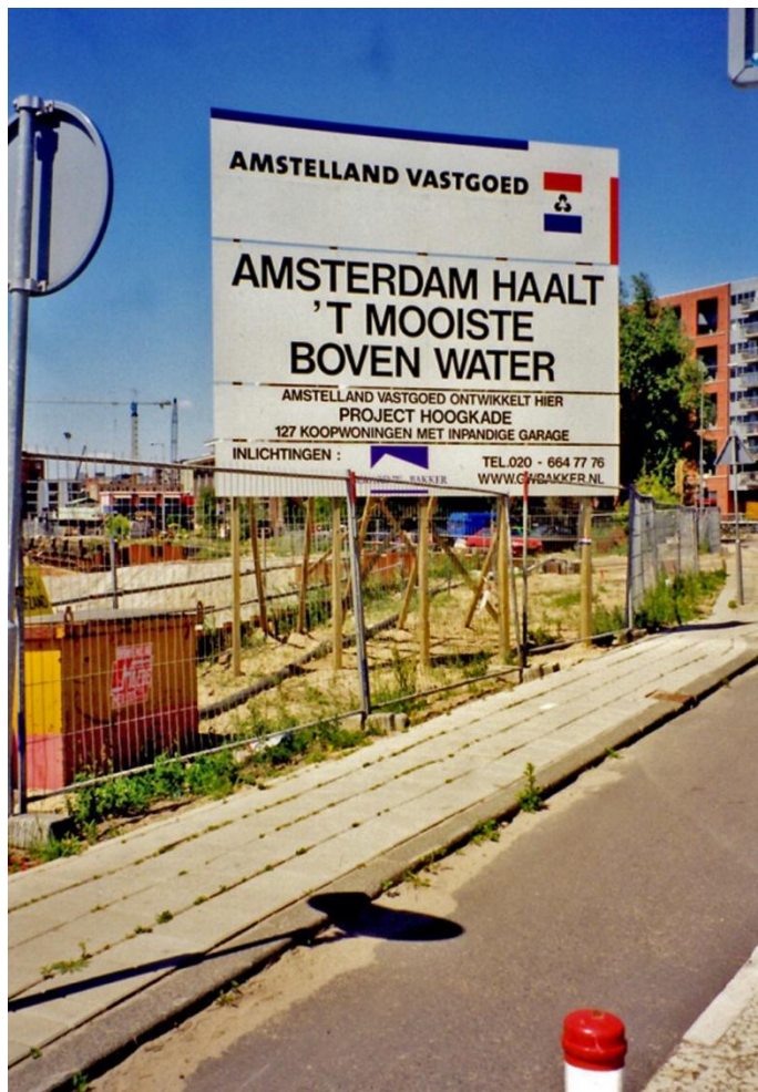
Dit bord stond op de Verbindingsdam. 't mooiste' was uiteraard Hoogkade in aanbouw