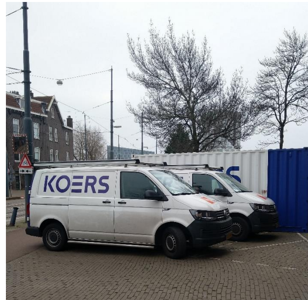
De container en (soms ook de busjes) van de firma Koers zijn sinds 17 januari een vertrouwd beeld aan de oostzijde van ons pand. Vanaf begin april hebben we hier weer alle ruimte.

U weet het via de aangepaste planning, een liftbrief en Arthur die in de week vooraf even aanbelt. Niemand thuis? "Ik plak een briefje op de deur." Een mail sturen kan ook, naar hoogkade@koers.nl . Of schiet de loodgieter even aan.